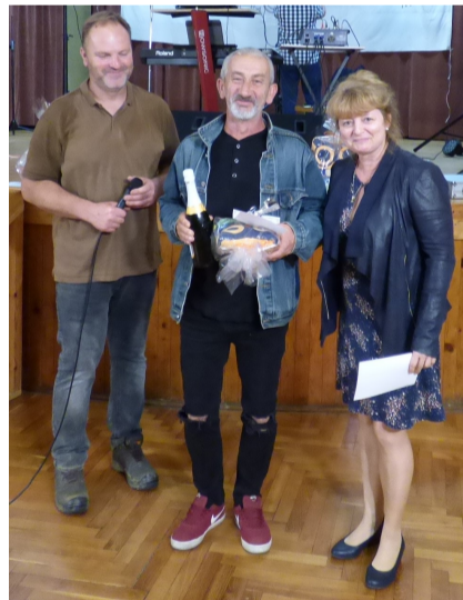
Az eredményhirdetést izgatottan várták a Bagolytúrás csapatok képviselői.