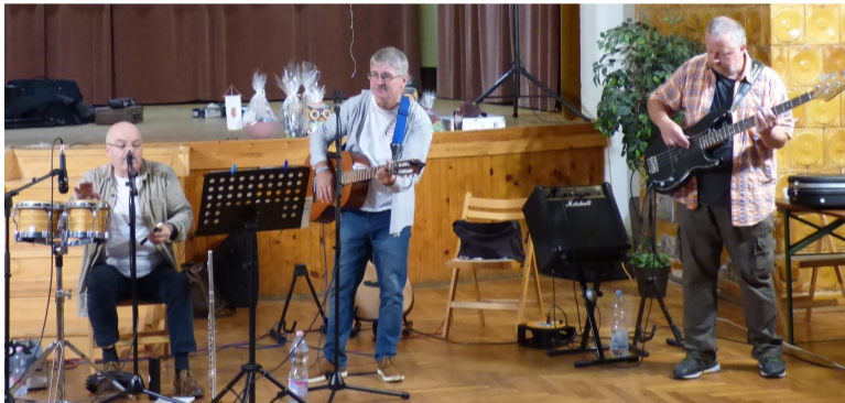
A Tarisznyások Zenekar tagjai egy másik közeli fellépésről érkeztek Ivánra, így az árvíz miatti útlezárások nem okoztak nekik akadályt.